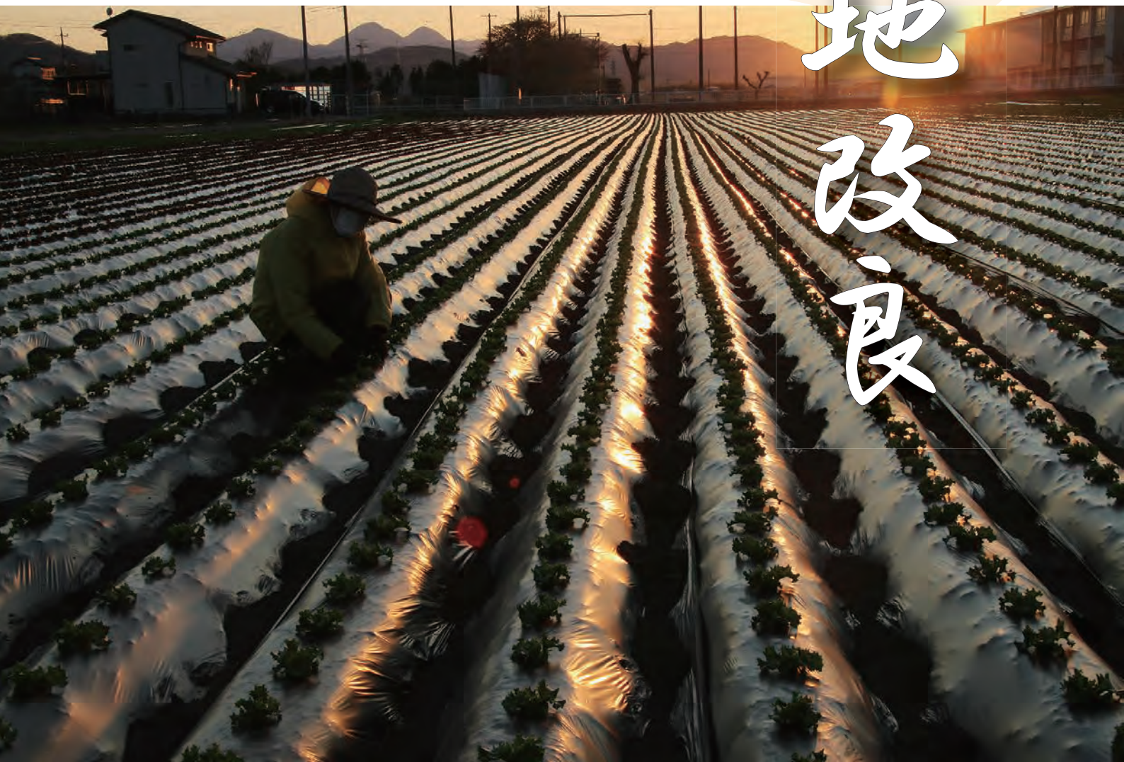
夕暮れの畑（美里町）