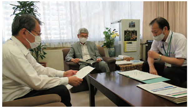
意見交換の様子 左から：大図常務理事、牧元農村振興局長、稲場農村整備課長