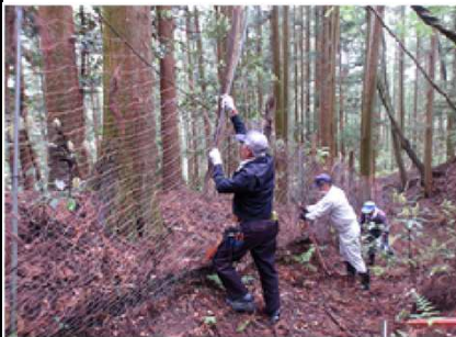
(広域防護柵管理作業)

活動対象の農地では農事組合法人「ちちぶあらかわ」が主にそばの作付を行っており、それが地域の特産品となっており、地域と自治体、「ちちぶあらかわ」の三者で協力して農地を活用する事が出来る環境づくりを整えています。