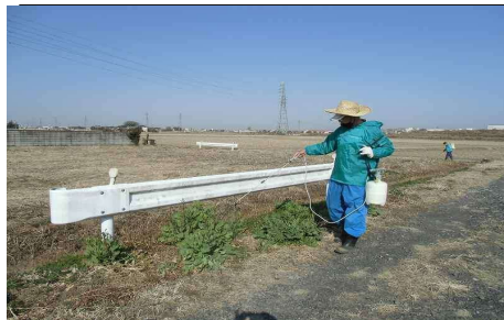
( 除草剤散布 )

当地区は、羽生市の南東部に位置し、東西に葛西用水路がはしる中手子林・上手子林・下手子林の3地区をエリアに含んだ水田を中心とした農村地帯です。 構成員である手子林第三土地改良区と共に、農業者を中心に水路や農道の草刈り等の農地維持活動に取り組んでいます。