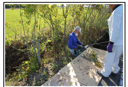
( 雑木の伐採 )