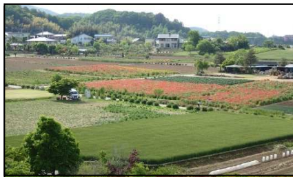
( 地域での植栽活動 )