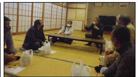
( 役員研修 )