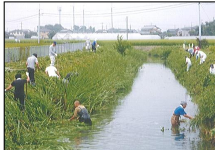
( 水路の草刈 )