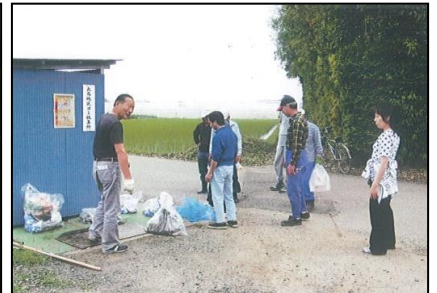
( 水路・農道の点検・清掃 )