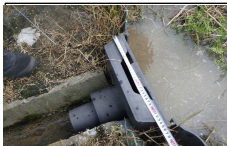
(田んぼダムの取組)

また、水害のリスク増大が懸念されている中で、営農しながら取り組むことができ、地域の防災・減災に貢献できる「田んぼダム」の取組を実施している。