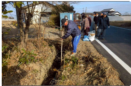
(美化推進活動・泥上げ)

当地区は加須市北川辺地域の西部に位置し、主に地域の東側から南側に住宅等が建ち並び、中央から東側に水田が広がる水田農業地帯である。 北川辺地域全体が利根川や渡良瀬川に囲まれた輪中地帯で河川が無く、多くの生活排水は農業用排水路に排出されている。 このことから、「農地・水、多面的」制度を活用する以前から地域全体で、年2回の水路の草刈り、泥上げ等や、美しい農村景観を保全するための点検、清掃などによる美化活動として、年3回のゴミ拾い、草刈り等の活動を長年取り組んできた。 このような地域をあげての取り組みにより、国土交通省の「水の郷百選」に選定されている。