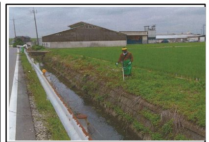
(水路草刈り・点検等)