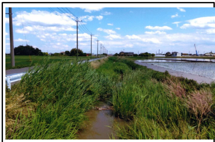
(水路の草刈り:実施前)

当地区は加須市北川辺地域の中央部で、地区の中央に中学校や公共施設があり、主に中央部に住宅が建ち並んでおり、地区の西と南に水田が広がる水田農業地帯である。北川辺地域全体が利根川や渡良瀬川に囲まれた輪中地帯で河川が無く、多くの生活排水は農業用排水路に排出されている。 このことから、「農地・水、多面的」制度を活用する以前から地域全体で、年2回の水路の草刈り、泥上げ等や、美しい農村景観を保全するための点検、清掃などによる美化活動として、年3回のゴミ拾い、草刈り等の活動を長年取り組んできた。 このような地域をあげての取り組みにより、国土交通省の「水の郷百選」に選定されている。