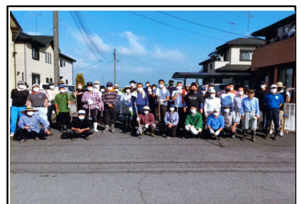
(水路の草刈り:会員)