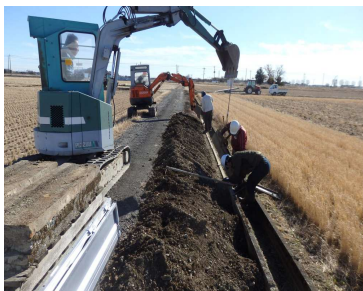
( 水路補修 )

当地区は羽生市の西部、行田市との境に位置し、地区の南側を国道125号バイパス、北から東側を県道上新郷埼玉線が走る水田農業地帯である。 主な活動としては、道水路の草刈や泥上げ、不法に捨てられたゴミの収集等を積極的に行い、農業者が一体となって維持管理活動に取り組んでいる。 また、水路の補修・更新作業や遊休農地解消のための畦畔除去作業といった資源向上活動(長寿命化)を直営で施工し、外注よりも安価での整備や、施工技術の継承等を行いながら、水田貯留機能の強化(田んぼダム)の取組も進めている。さらに、地域内の主要道路沿いに地域の住民と花苗を植栽し、多面的活動をPRするのぼり旗を設置するなどして、活動の啓蒙啓発をして、親交を深めている。