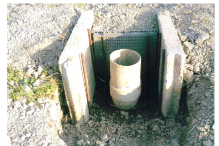
( 田んぼダム )