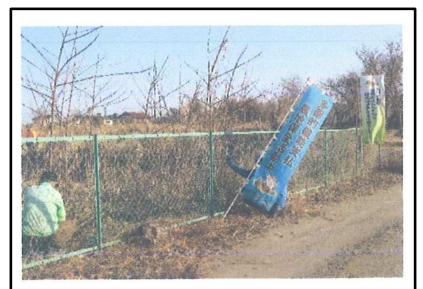
( 農道の草刈り )