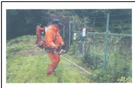
( ため池の草刈り )

今市地区では豊富な水資源を活用し、水田農業を盛んに行っている。本地区ではウォーキングや犬の散歩コースとして利用する方が多くいるため、農道の草刈りやため池の安全確保を行っている。遊休農地が発生しないよう、活動範囲内の農地の適正管理を行い、農地中間管理機構の利用も検討する。 また、春は地区の人が桜並木を快適に歩けるよう景観形成に努める。