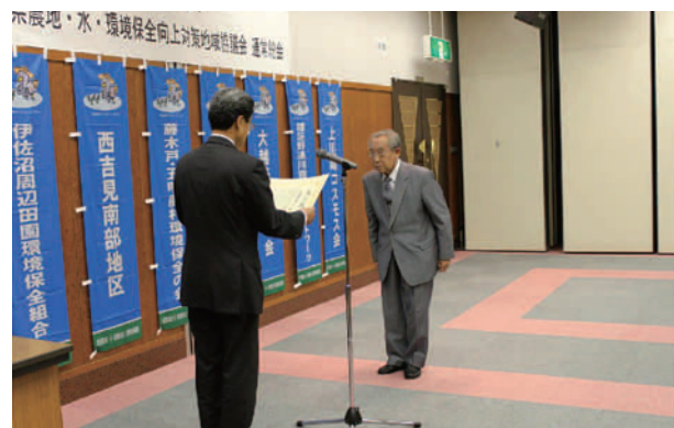
◆優良事例表彰の様子